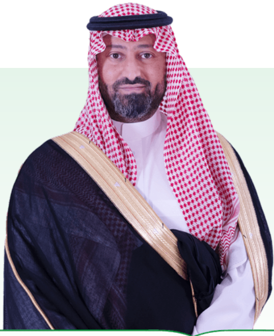
نايف بن سلطان بن محمد بن سعود الكبير رئيس مجلس الإدارة

يسعدني أن أشارككم تقرير الاستدامة الخاص بشركة المراعي لعام 2023، فقد حققنا هذا العام تقدماً ملحوظاً في مبادرات الاستدامة الخاصة بنا، وحرصنا على مواصلة جهودنا مع الأهداف والالتزامات التي حددتها إستراتيجية “أداءً أفضل كلَّ يومٍ”.